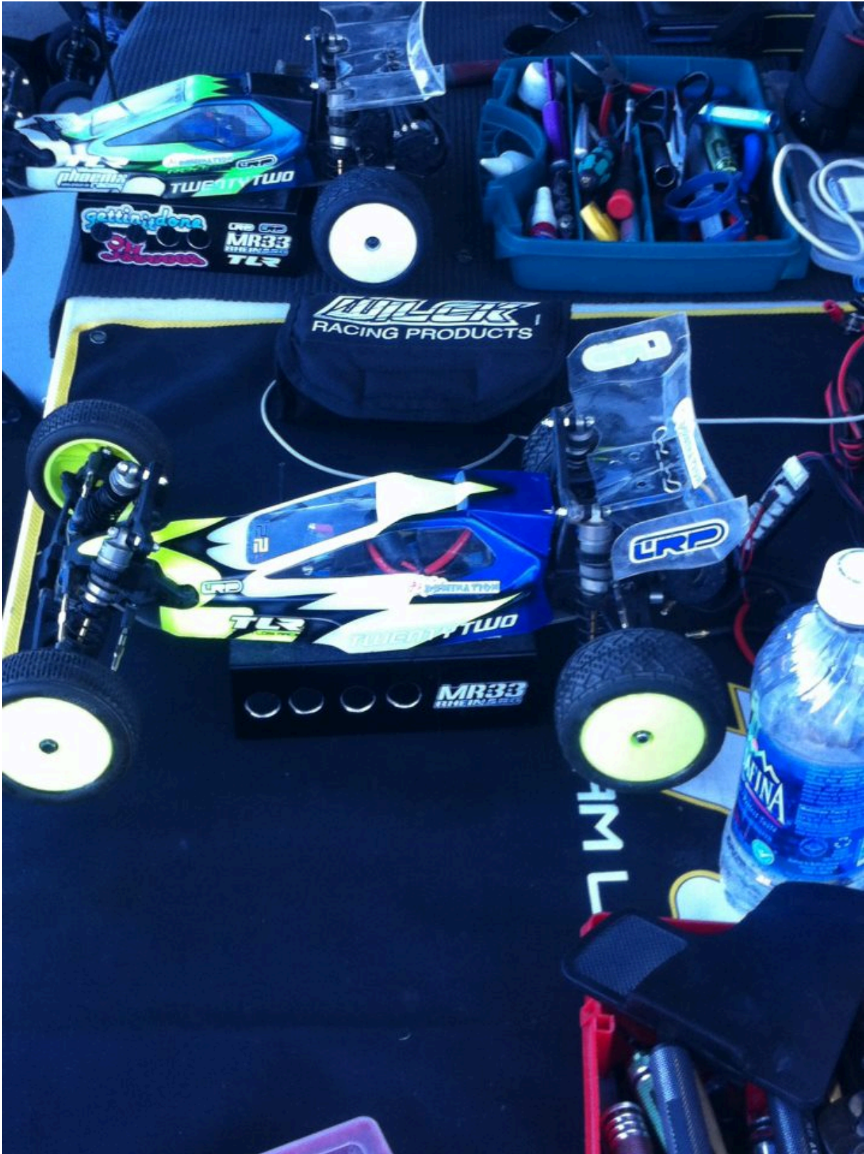
Min tävlingsbil under Cactus classic 2012