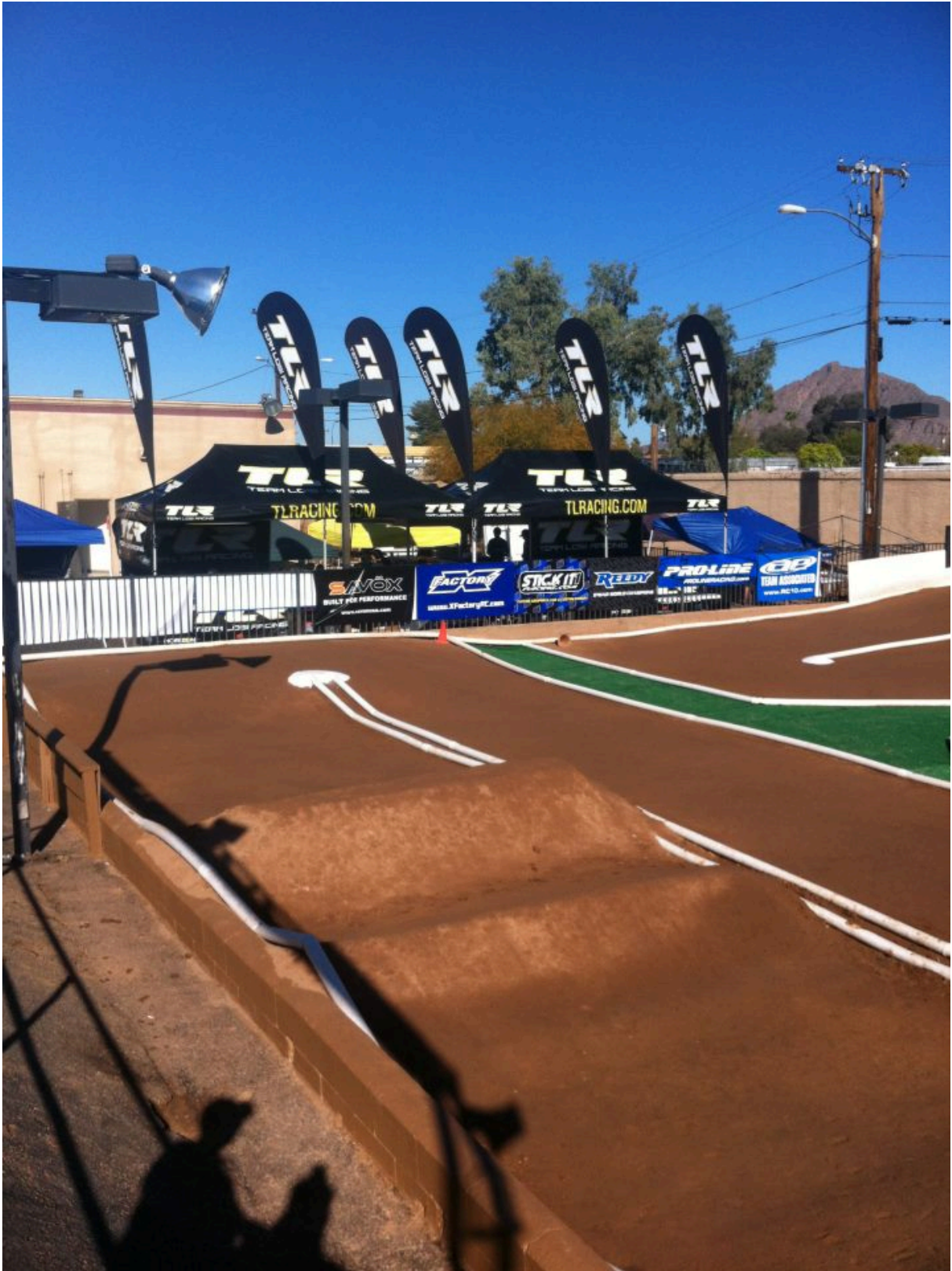
TLR Mek. Tält våra platser